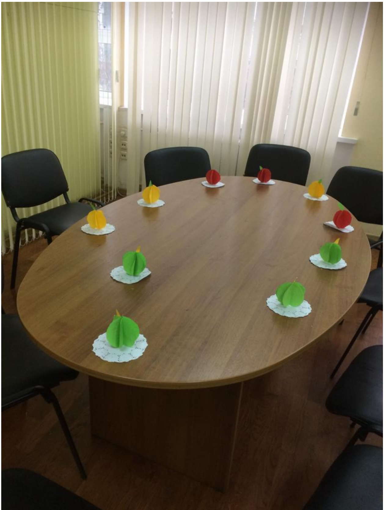
Тема занятия №3: «Новогодняя ёлочка»