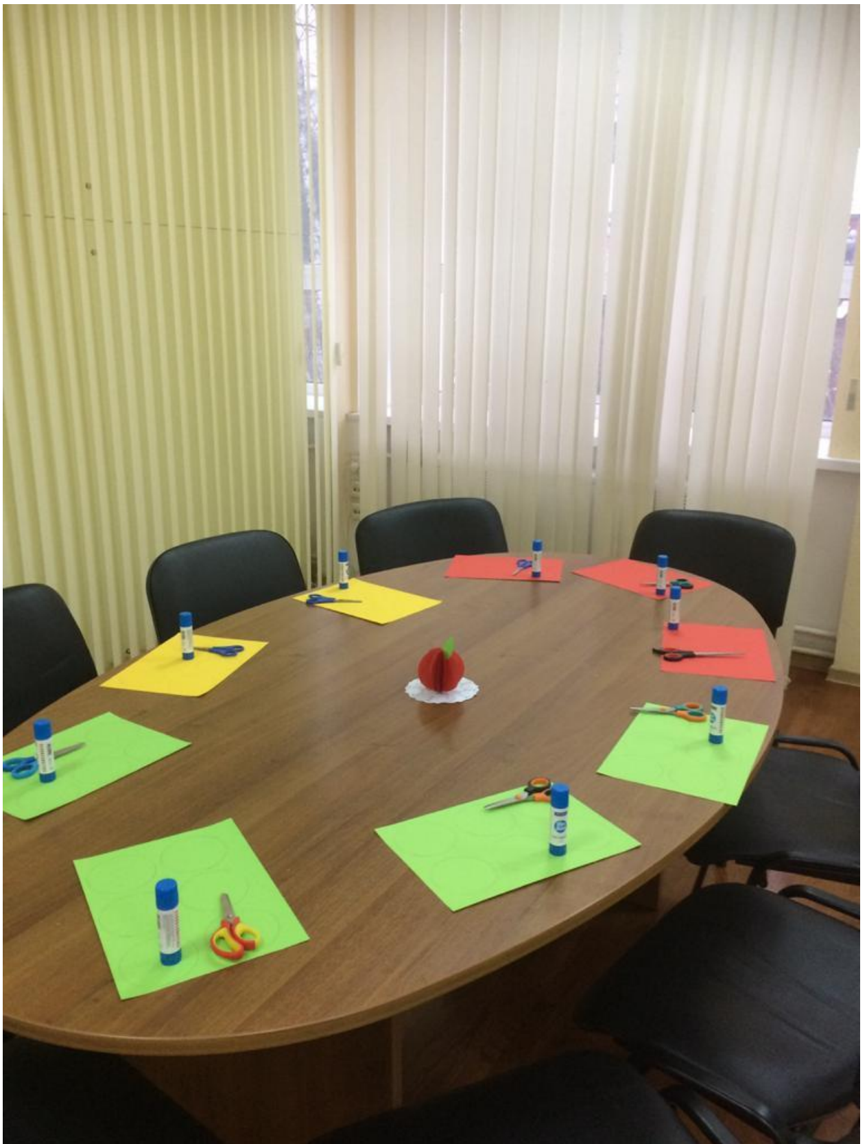
: «Осенний лес»